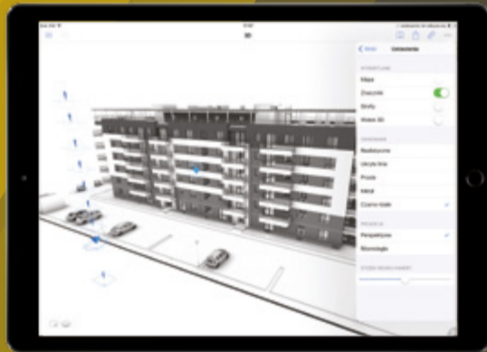
Budynek wielorodzinny w Radzyminie, UPPB Piotr Brzozowski, Remigiusz Staroń, Rafał Figiel

Perspektywa czy aksonometria? Widok Stereo 3D? Może spacer w scenie VR? Możesz wybrać jeden z kilku sposobów prezentacji aby najlepiej zaprezentować swój projekt. Z pomocą przyjdą też style cieniowania modelu oraz przekroje 3D.