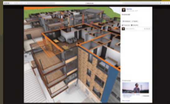
Nordre Jarlsberg Brygge Norway

Projekty BIMx możesz udostępnić korzystając z popularnych usług, jak Dropbox, iCloud Drive, Google Drive czy specjalnej strony BIMx Transfer Site. Dzięki temu projekty automatycznie zsynchronizują się z urządzeniem, na którym będą odtwarzane. Projekt możesz również udostępnić w mediach społecznościowych, a także wyświetlić w formie panoramy 360° na Facebooku!