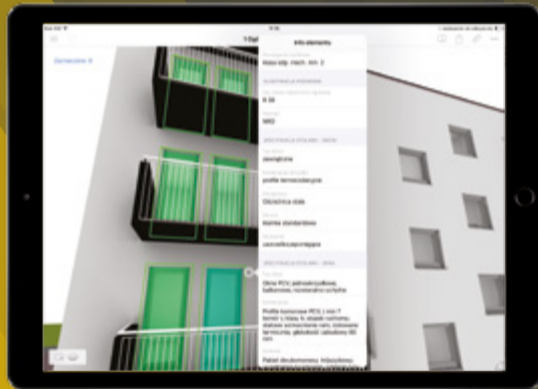
Zespół budynków mieszkalnych Chorzów, BUA Profil

Modele BIM przechowują ogromną ilość danych, a dzięki aplikacji BIMx mamy swobodny wgląd nie tylko w trójwymiarową makietę i powiązaną dokumentację, ale również w informacje powiązane z elementami modelu. Projekty możesz aktualizować do najnowszej udostępnionej wersji bezpośrednio w aplikacji BIMx.