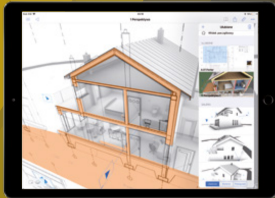
Projekt, arch. Rafał Ślęk

Wyjątkowy sposób prezentacji projektu w BIMx polega na płynnej synchronizacji modelu 3D z dokumentacją rysunkową oraz informacjami o elementach. Przygotowane rysunki zobaczysz w tym miejscu modelu, z którego zostały wygenerowane. Przeglądanie dokumentacji projektu jeszcze nigdy nie było tak proste i widowiskowe, czytelne nawet dla osób niezwiązanych z branżą projektową.