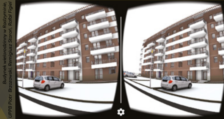
Budynek wielorodzinny w Radzyminie, UPPB Piotr Brzozowski, Remigiusz Staroń, Rafał Figiel